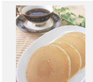
ミニホットケーキ