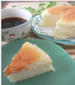
スフレチーズケーキ