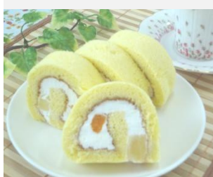
フルーツロールケーキ