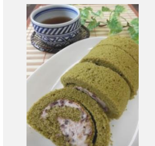
抹茶ロールケーキ