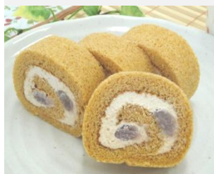
小豆と餡のロール ケーキ