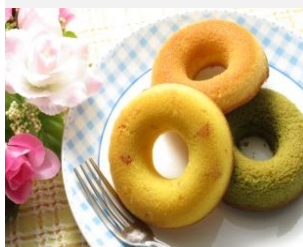
米粉の焼きドーナツ