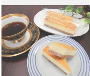
ペイコド チーズケーキ