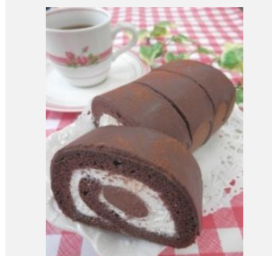
生チョコロールケーキ