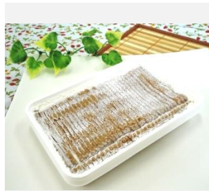
ボックスモンブラン