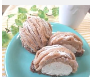
渋皮栗の モンブラン