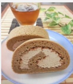
コーヒーロールケーキ