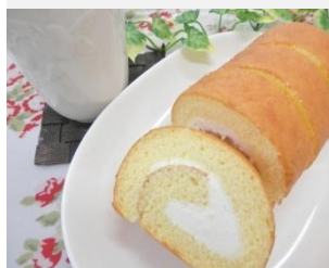
米粉のロールケーキ