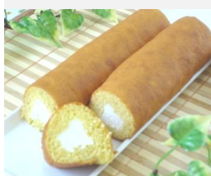
細巻きロールケーキ 約17cm巾約35mm~40mm