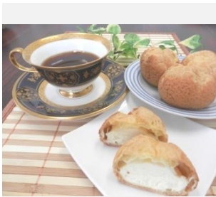
自家製カスタード入 シュークリーム