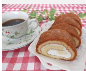
ブリュレロールケーキ