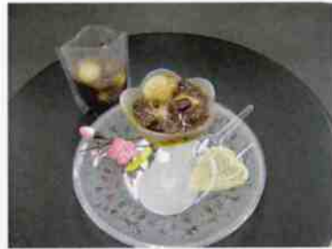
白玉ぜんざい g 10×15 (450)