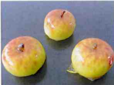
花もち (姫りんご) 17g 15×30 p (450)