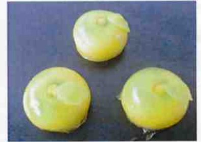
花もち (青みかん) 17g 15×30 p (450)