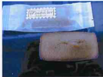
フィナンセ チョコ