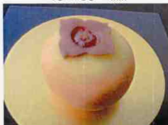
生菓子 (柿) 45×35 mm