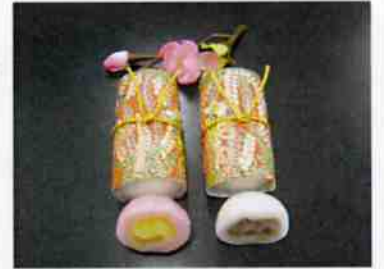
夢づつみ (祝い) g 12×30 p (360)