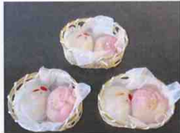
お祝いセット 34g 7×24p (168)