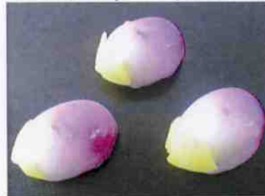
花もち (茄子) 17g 15×30 p (450)