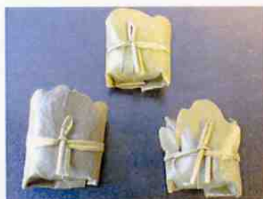
三柏 15×30 p (450)