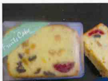
フルーツバターケーキ