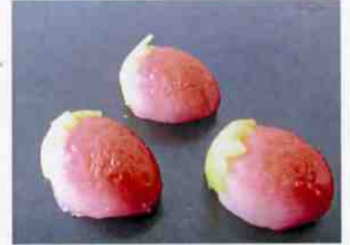
花もち (いちご) 15×30 p (450)