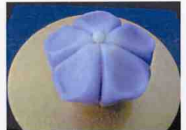
生菓子 (桔梗) 45×35 mm