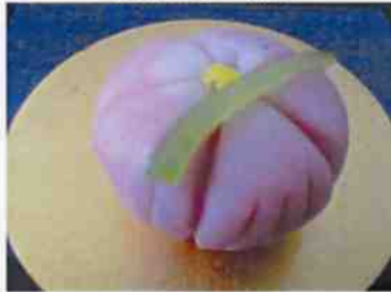
生菓子 (撫子) 45×35 mm