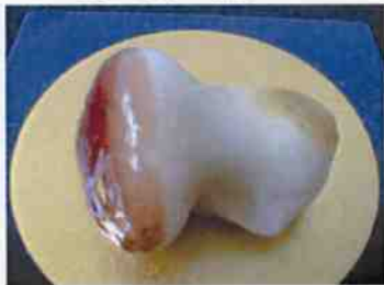
生菓子 (松茸) 45×35 mm