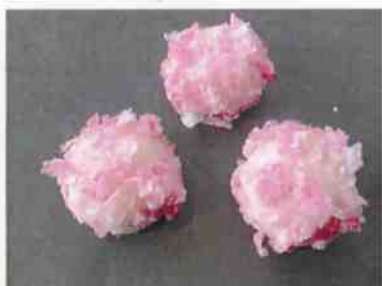
いちごの里 24g 10×30p (300)