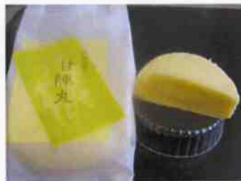
甘陣丸（蒸しケーキ）