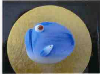
生菓子 (青鯉) 45×35 mm