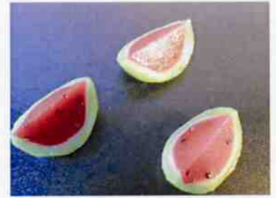
花もち (すいか) 12g 15×30 p (450)