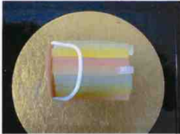
生菓子 (吹流し) 45×35 mm