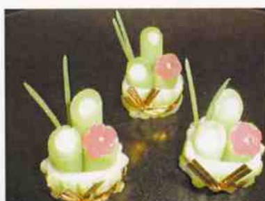
門松 23g 15×15p (225)