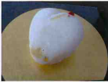
生菓子 (鶴) 45×35 mm