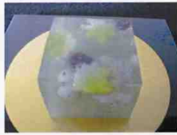
生菓子 (せせらぎ) 45×35 mm