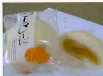
マーマレード饅頭