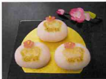
花もち (干支) 10×36p (360)