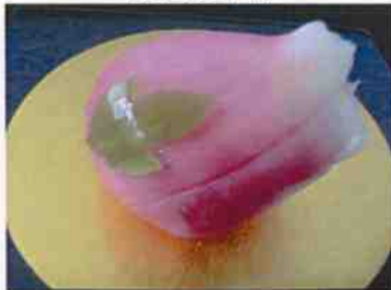
生菓子 (牡丹) 45×35 mm