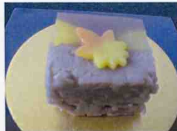
生菓子 (深山路) 45×35 mm