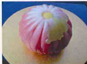
生菓子 (八重菊) 45×35 mm