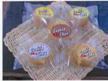
クッキシュー チョコ・カスター・小豆・バナ・モカ