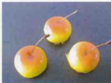
花もち (フェリ-) 17g 15×30p (450)