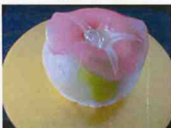
生菓子 (朝顔ピンク) 45×35 mm