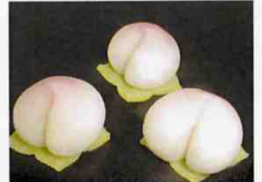
花もち (桃) 17g 15×30 p (450)