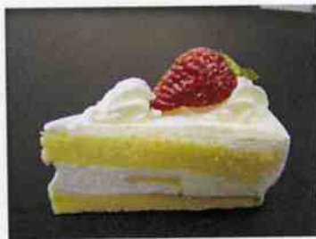
季節のフルーツショートケーキ