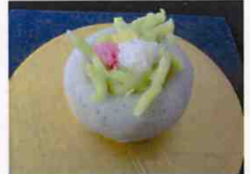
生菓子 (三色すみれ) 45×35 mm