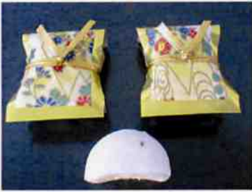
友禅小町 17 g 8×30 p (240)