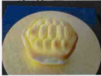
生菓子 (カメ) 45×35 mm