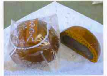
まるきんまんじゅう