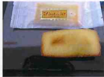
フィナンセアモンド