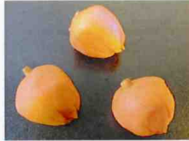
花もち (ほおずき) 17g 15×30 p (450)