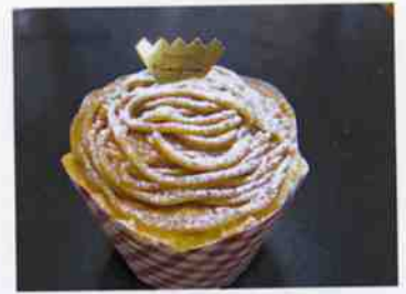
カップ入モンブラン