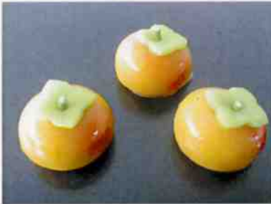
花もち (柿) g 15×30 p (450)