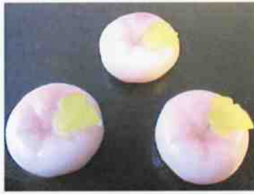
花もち (朝顔ピンク) 17g 15×30 p (450)