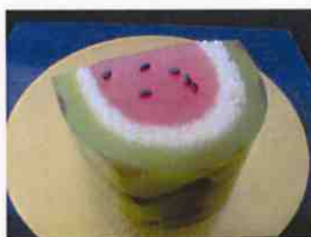
生菓子 (すいか) 45×35 mm