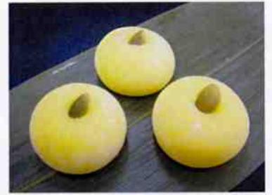
柚子もち 16 g 15×30 p (450)