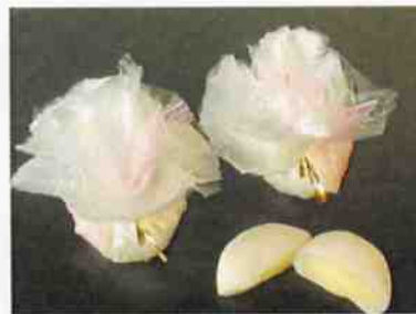
クリーム包み 24 g 10×30 p (360)