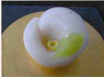
生菓子 (寒椿白) 45×35 mm