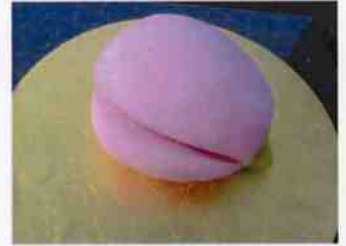
生菓子 (ももの花) 45×35 mm