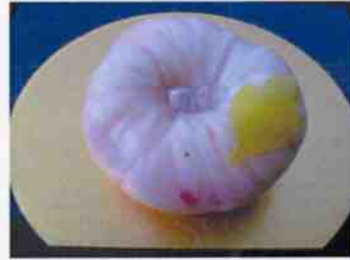
生菓子 (朝露) 45×35 mm