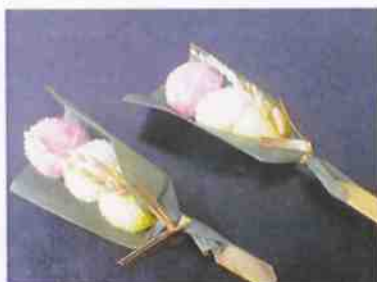
豊年もち 23g 8×30p (240)