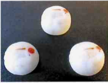
花もち (鶴) 17g 15×30 p (450)