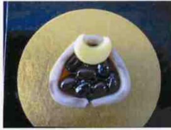
生菓子 (兜) 45×35 mm