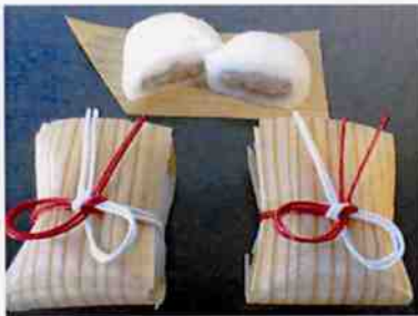
杉板小町 20 g 12×30 p (360)