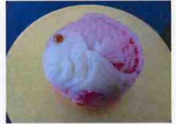
生菓子 (鯛) 45×35 mm