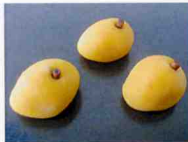
花もち びわ 15×30 p (450)