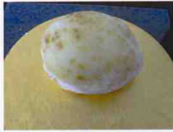
生菓子 (野焼き) 45×35 mm