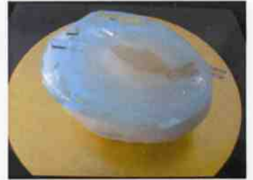
生菓子 (のぼり鮎) 45×35 mm