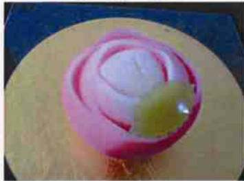
生菓子 (薔薇) 45×35 mm