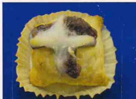
もち入りパイ饅頭焼成後