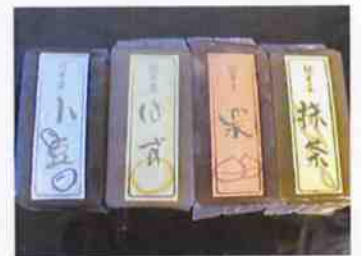
練羊羹 小豆・抹茶・栗・柚子