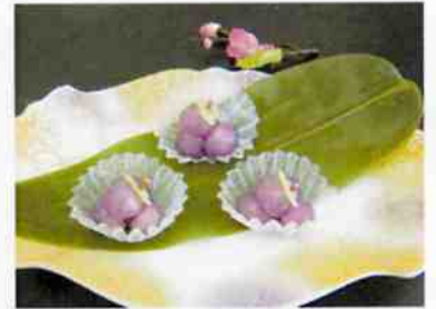
葛ぶどう 15×36 (540)