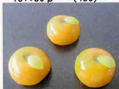
花もち (みかん黄) 17g 15×30 p (450)