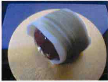
生菓子 (竹) 45×35 mm