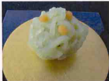
生菓子 (橘) 45×35 mm