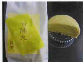
抹茶カスター（蒸しケーキ）