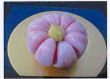
生菓子 (コスモス) 45×35 mm