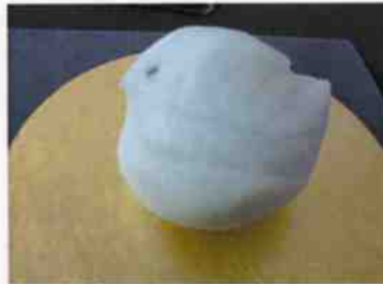
生菓子 (水鳥) 45×35 mm