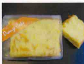
オレンジバターケーキ