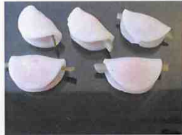
花びらもち 17g 18×24p (432)