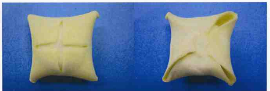
もち入りパイ饅頭 焼成前(表)