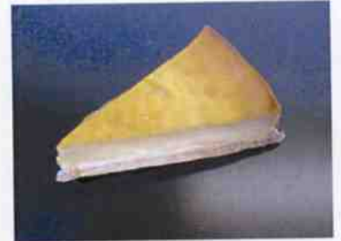
パイ生地チーズケーキ