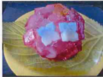
生菓子 (紫陽花) 45×35 mm