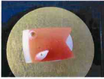
生菓子 (こいのぼり) 45×35 mm