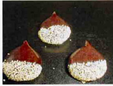
栗もち 16 g 15×30 p (450)