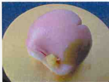
生菓子 (山茶花) 45×35 mm