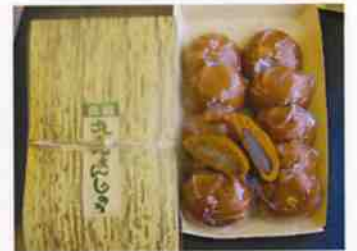
元祖丸きんまんじゅう 黒あん・しろあん