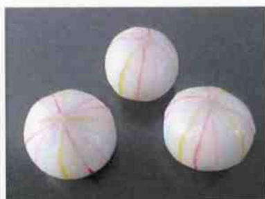
手まり 15×30p (450)