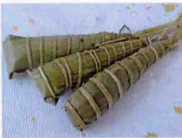
ちまき 50×3 (150)