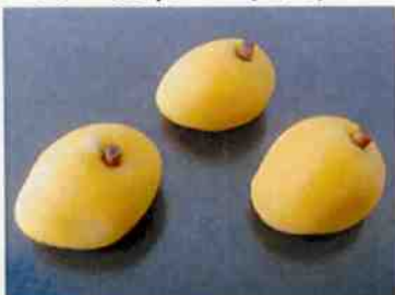
花もち (びわ) 17g 15×30 p (450)