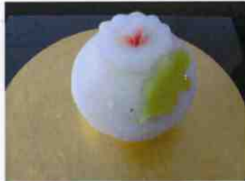
生菓子 (玉菊) 45×35 mm