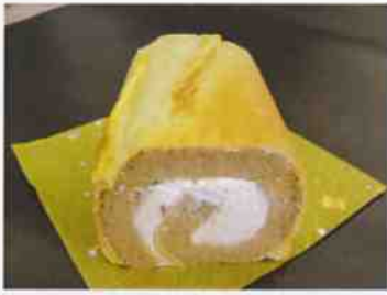
コーヒーシュール