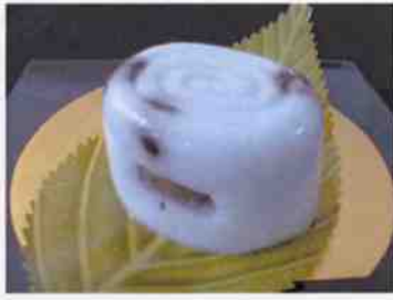
生菓子 (淡雪かん) 45×35 mm