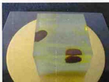
生菓子 (蛭) 45×35 mm