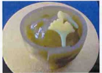
生菓子 (小さい秋) 45×35 mm