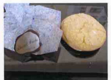
ブッセアーモンド