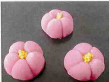
花もち (紅梅) 17g 15×30 p (450)