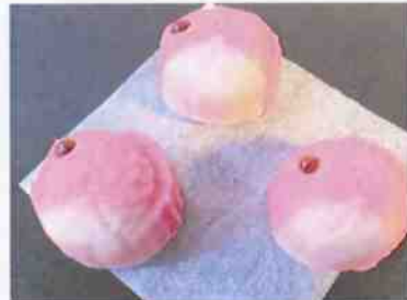
花もち (めで鯛) 12g 15×30p (450)