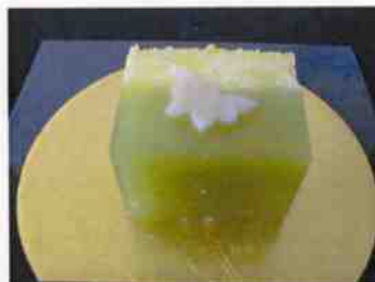
生菓子 (菜畑) 45×35 mm