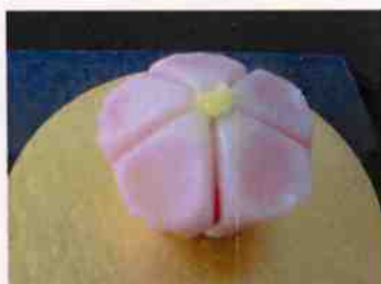
生菓子 (吉野桜) 45×35 mm