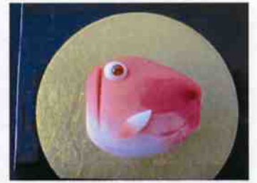
生菓子 (赤鯉) 45×35 mm