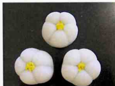
花もち (白梅) 17g 15×30 p (450)