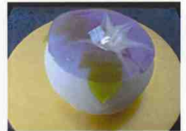
生菓子 (朝顔青) 45×35 mm