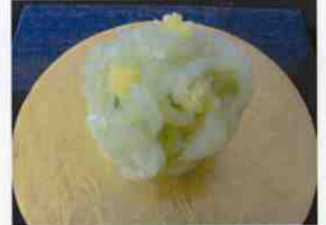
生菓子 (菜の花) 45×35 mm