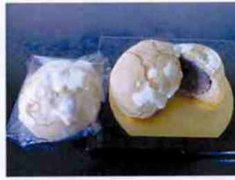
はったいまんじゅう