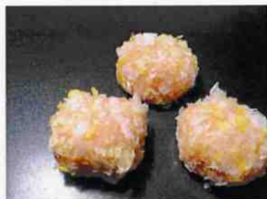
みかんの里 24g 10×30p (300)