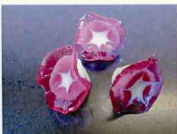
前菜あさがお 紫 15×30 p (450)