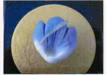
生菓子 (あやめ) 45×35 mm