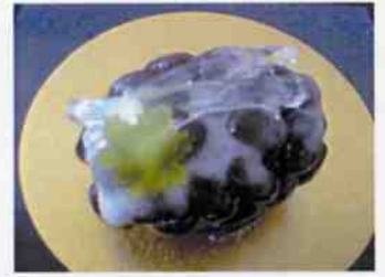
生菓子 (清流) 45×35 mm