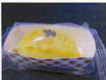
ミニスイートポテト