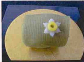
生菓子 (水仙) 45×35 mm