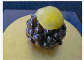
生菓子 (栗かの子黒) 45×35 mm