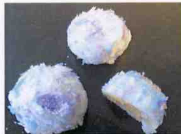
紫陽花 24g 10×30p (300)