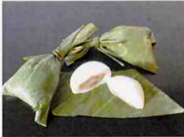
笹茶巾 18 g 50×10袋 (500)