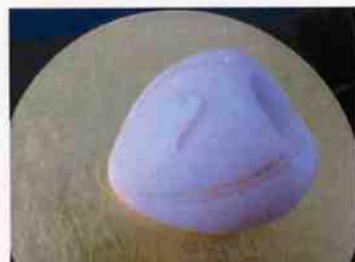
生菓子 (ぼんぼり) 45×35 mm