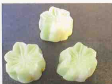
花もち (青もみじ) 16g 15×30p (450)