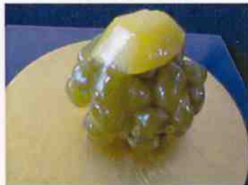
生菓子 (栗かの子緑) 45×35 mm