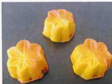
花もち (赤もみじ) 16g 15×30p (450)