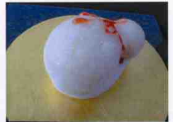
生菓子 (ひさご) 45×35 mm