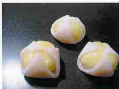
クリームふくさ 17g 15×30p (450)