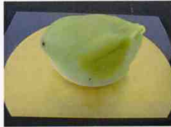
生菓子 (うぐいす) 45×35 mm