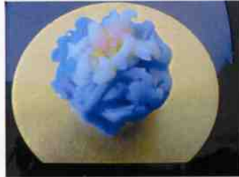
生菓子 (糸菊) 45×35 mm