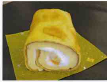
フルーツシュール