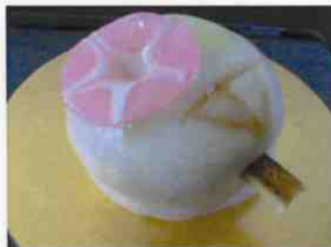
生菓子 (うちわ) 45×35 mm